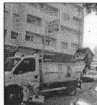
servizio a pagina 7

CAMPOBASSO. La Sea in primis e la nuova amministrazione comunale dovranno ora spiegare ai grillini perché quei tre cassonetti di colore diverso vengono svuotati tutti nello stesso camion così come testimoniano le immagini. In barba alla raccolta differenziata.