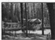
servizio a pagina 13

Nel pomeriggio l'annuncio ufficiale del governatore