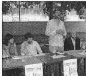
servizio a pagina 2

CAMPOBASSO. Pippo Civati rivendica il ruolo di minoranza all'interno del Pd. Allo stesso tempo rinnova a Renzi l'invito a costruire un partito "dove tutti contano". A Campobasso per presentare il suo libro "Qualcuno ci giudicherà" Civati parla anche dei componenti del nuovo Senato, del loro doppio incarico e dell'immunità.