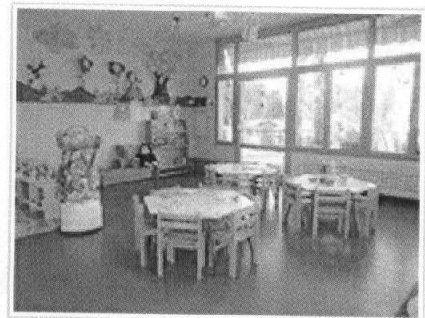
Le istanze vanno presentate entro le ore 13 del 16 ottobre 2013

Dopo il protocollo d'intesa siglato lo scorso 28 agosto, presso l'Assessorato alle Politiche sociali, con l'Ufficio Scolastico Regionale, i Comuni e i sindacati, la Regione Molise ha mantenuto gli impegni assunti in quella sede, dove era stato stabilito che, entro il 15 settembre, si sarebbe provveduto alla pubblicazione di apposito Avviso pubblico rivolto ai Comuni molisani interessati all'iniziativa. Promessa mantenuta e concretizzata con la pubblicazione di apposita determina dirigenziale del Servizio Assistenza socio-sanitaria e Politiche sociali sul numero 25 del Bollettino Ufficiale della Regione Molise del 16 settembre scorso.