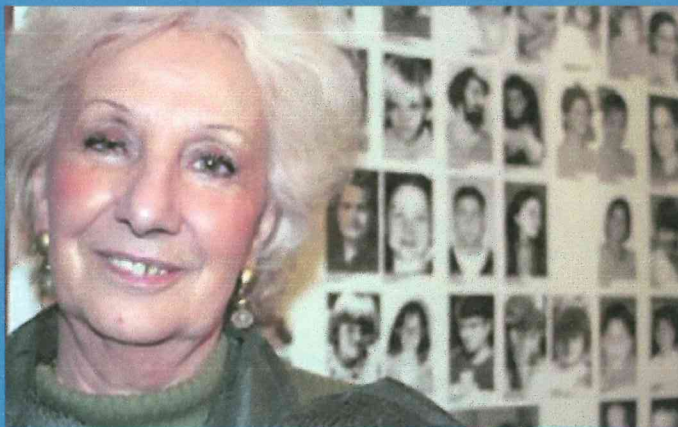
Estela Carlotto, presidente di Abuelas de Plaza de Mayo

Ambasciata della Repubblica Argentina in Italia Sezione Diritti Umani