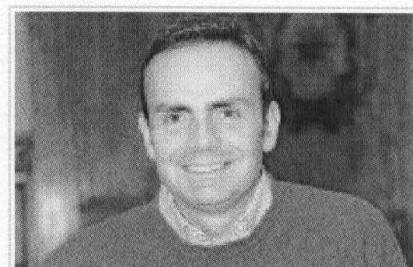
Il presidente Paolo di Laura Frattura

"Poniamo un altro tassello sostanzioso per il completamento della ricostruzione post sisma del nostro Molise. Manteniamo fede agli impegni presi con i nostri cittadini e le nostre aziende, portando avanti ogni giorno un lavoro rigoroso e trasparente". Il presidente della Regione Molise, Paolo di Laura Frattura, esprime soddisfazione per la firma del nuovo Apq.