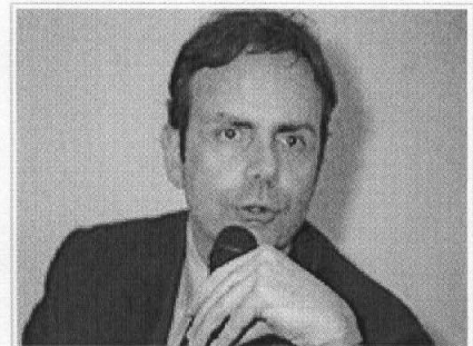
Frattura: "Si tratta dell'ultimo e più importante atto per quanto riguarda le assegnazioni disposte dalla delibera Cipe in favore della ricostruzione post sisma del Molise"

L'appuntamento alle ore 11.30 nella sala giunta della sede regionale di via Genova, 11, a Campobasso.