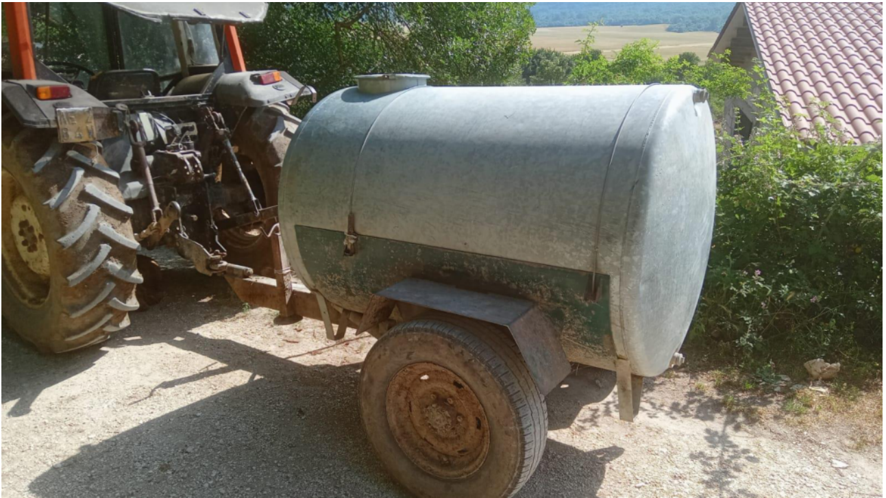
Cisterna per il prelievo dell'acqua