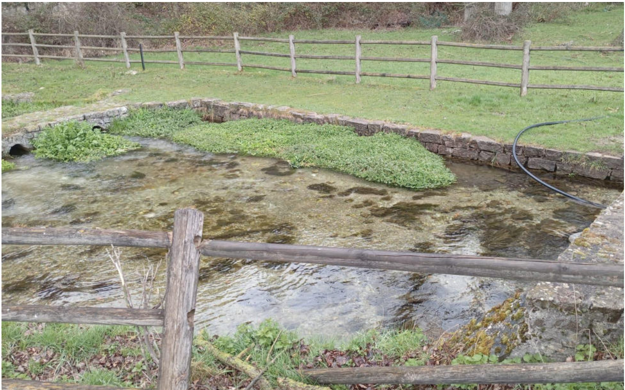
Vasca dove sorge e viene attinta l'acqua