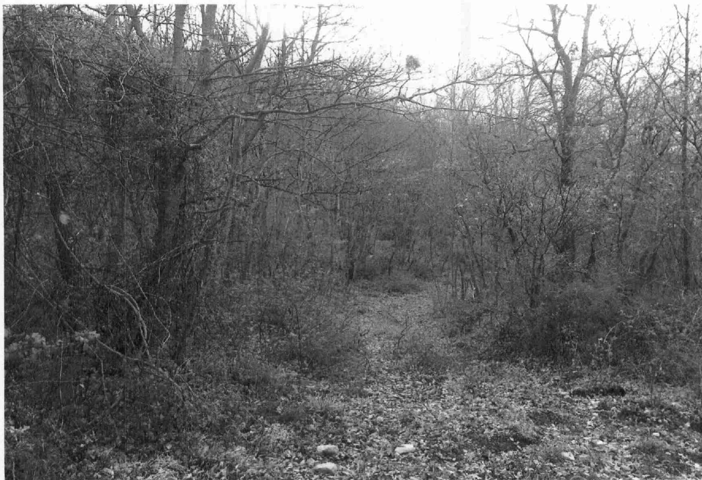
Foto n.1 - Viabilità