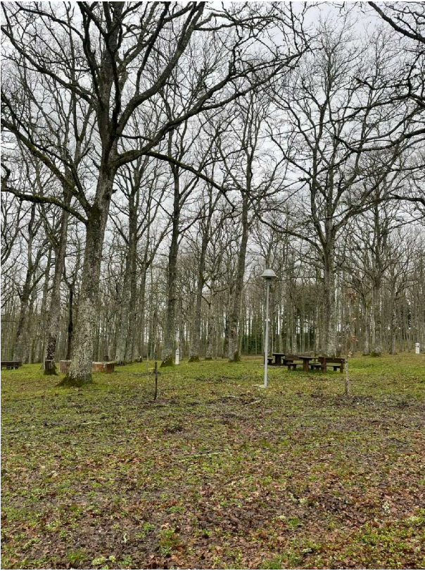
Immagini generali dell'area oggetto dell'attività