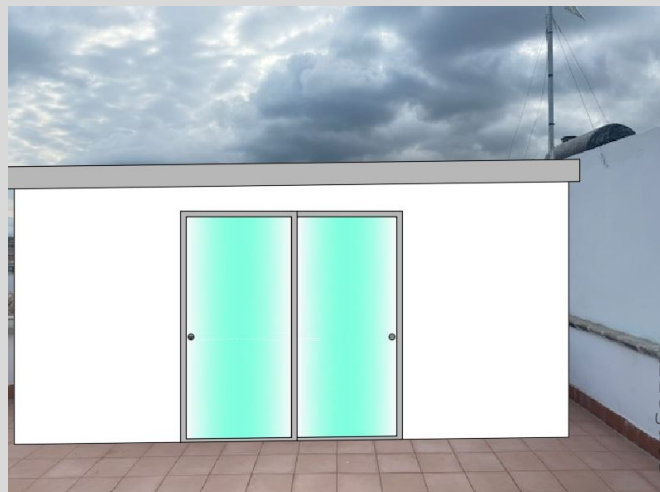
Foto inserimento del manufatto da realizzare