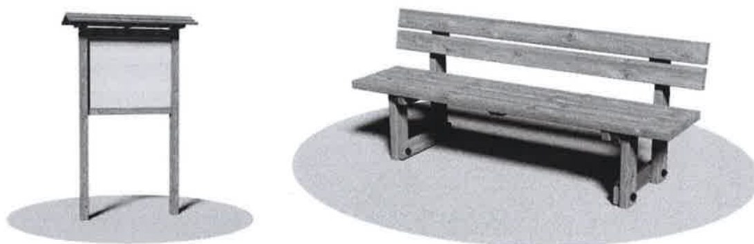
Esempi di forniture da installare

L'intervento, quindi, non produrrà alcun incremento della vulnerabilità ambientale e gli effetti delle opere possono dichiararsi del tutto trascurabili.