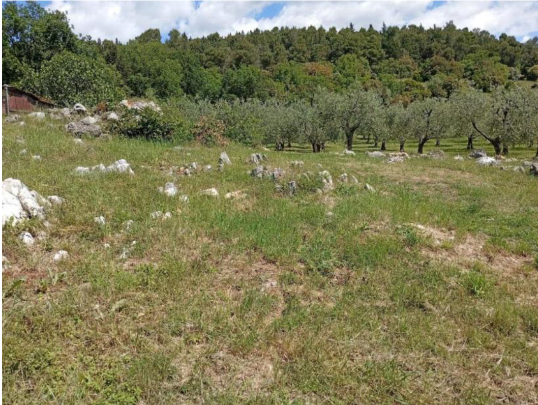
Area d'intervento p.lla 763