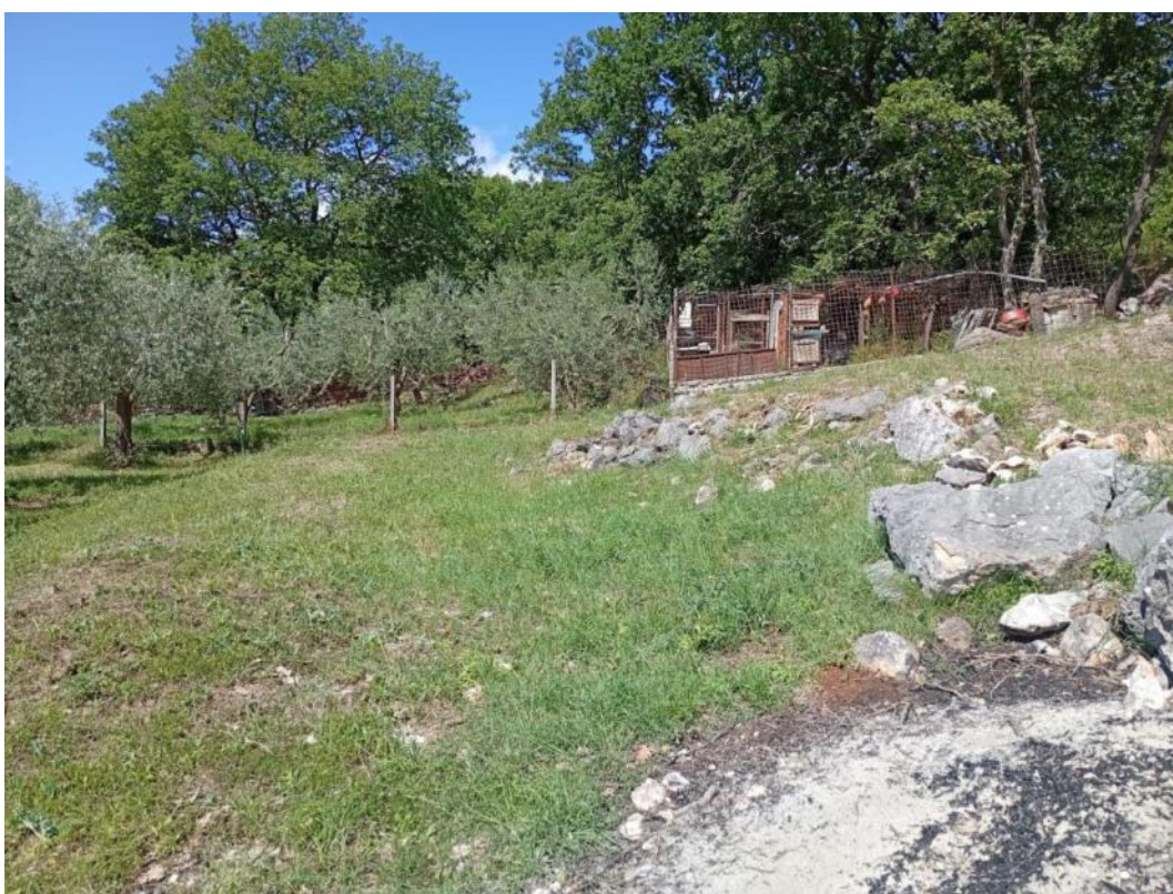
Area d'intervento p.lla 759