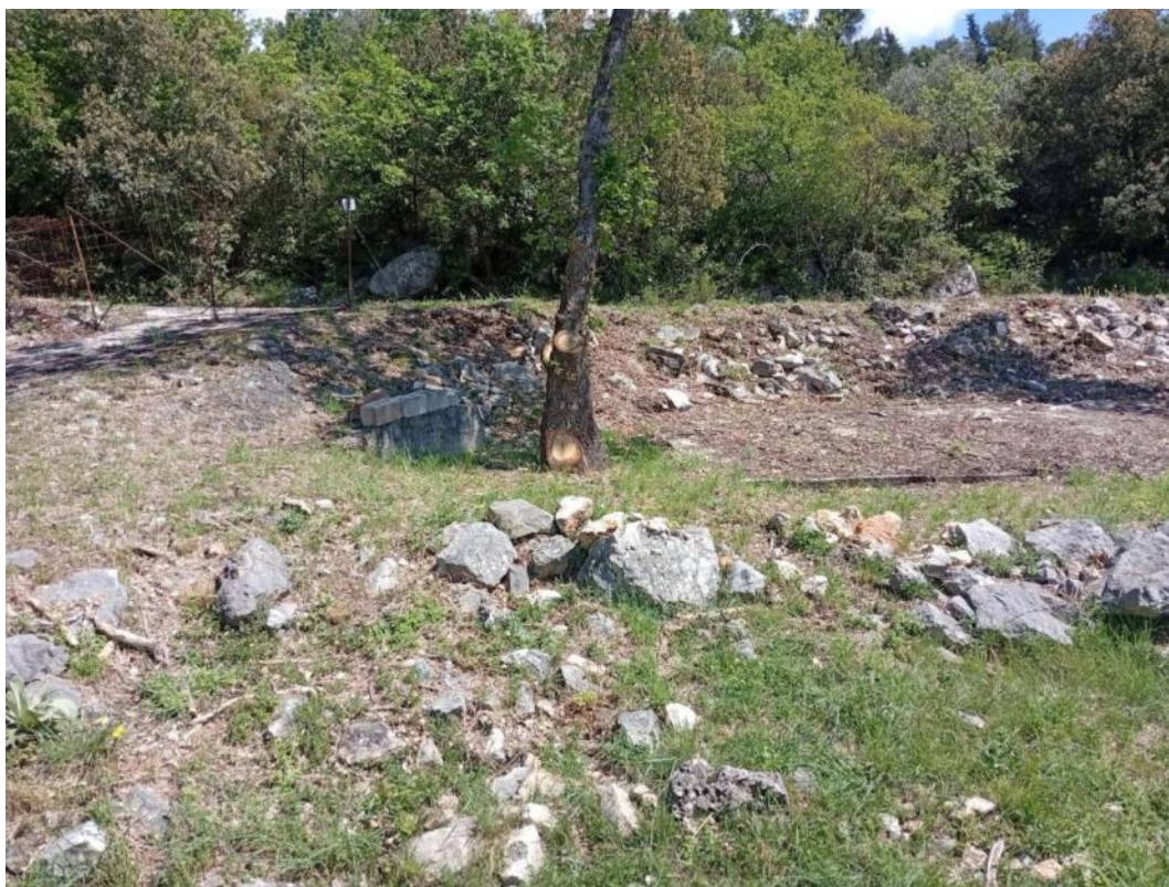
Area d'intervento p.lla 759