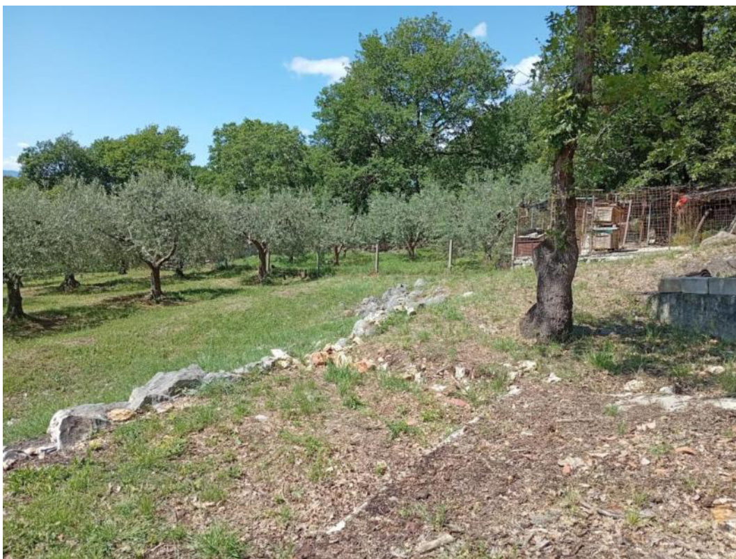
Area d'intervento p.lla 759