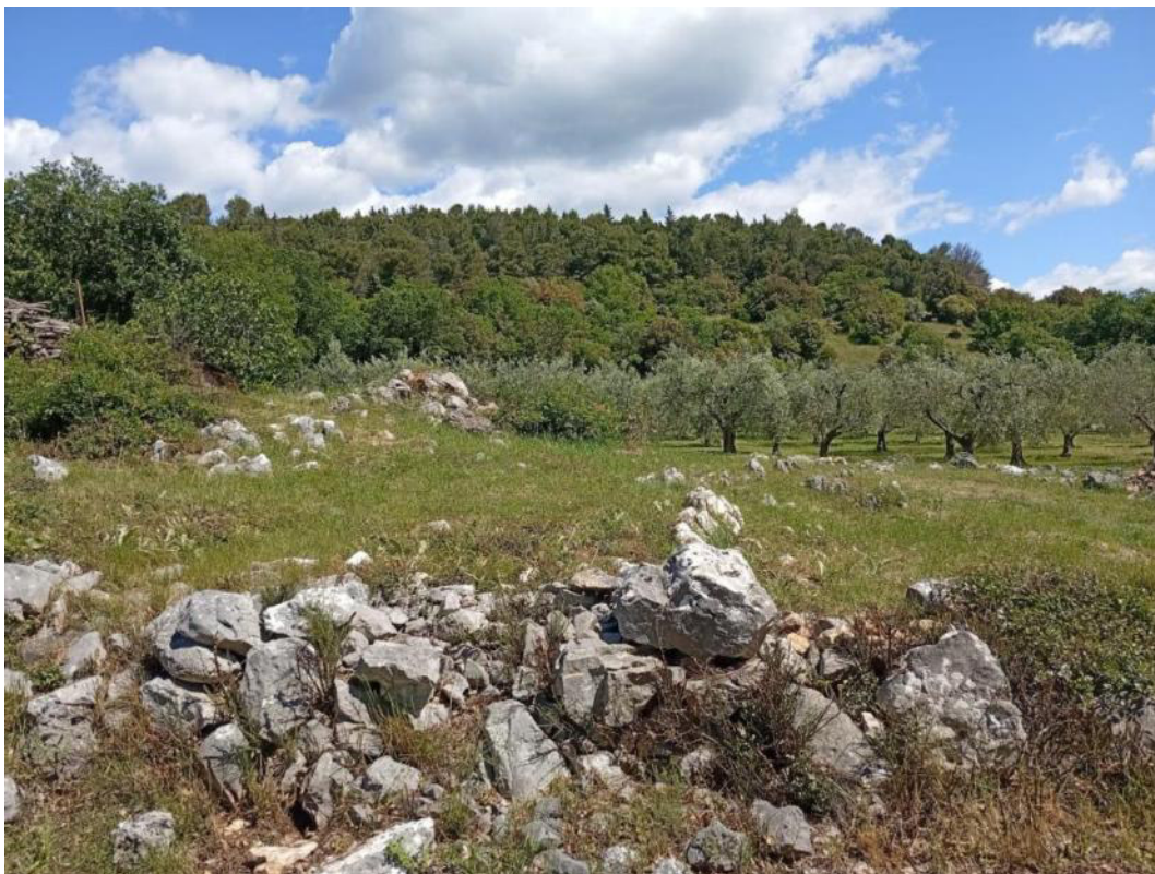
Area d'intervento p.lla 761, pietre da allontanare