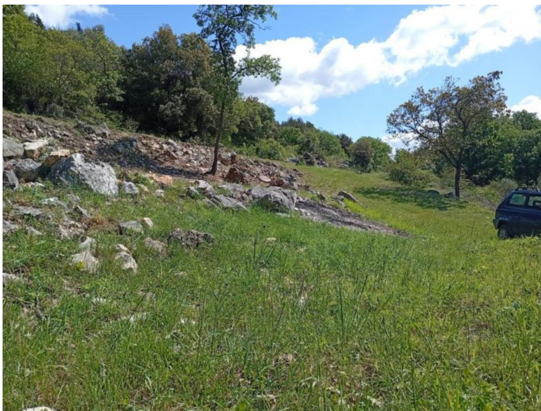
Area d'intervento p.lla 759