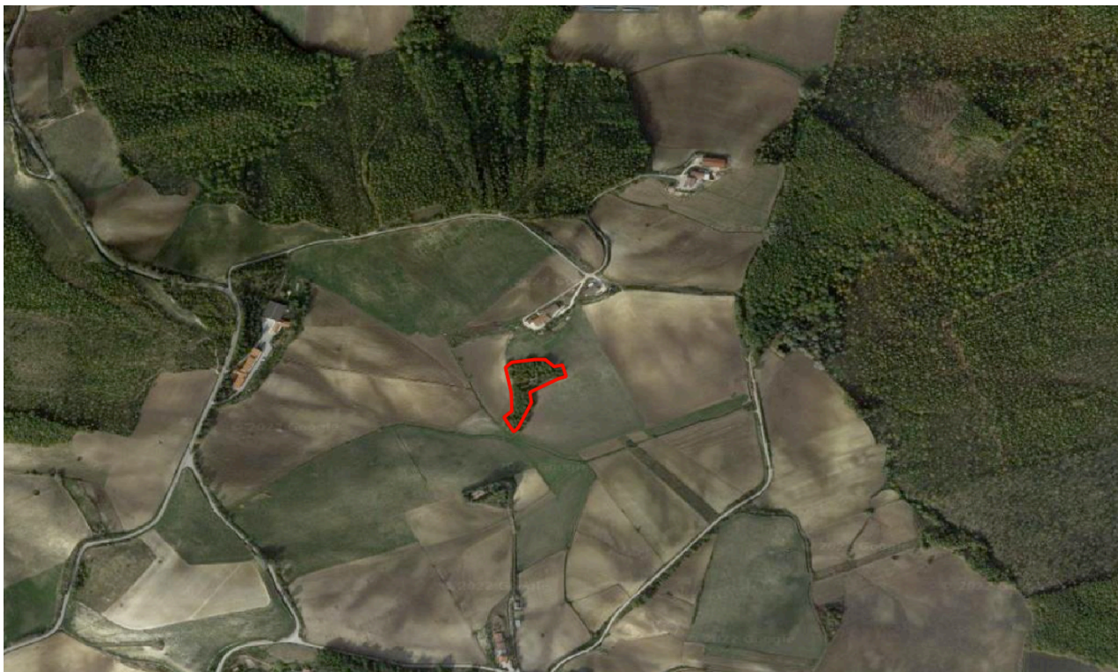
Stralcio cartografico da immagini satellitari (google maps) con area d'intervento