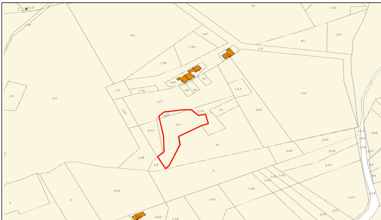
Stralcio cartografico catastale con individuata l'area di taglio foglio n° 1 p.lle 26 e 226 comune di Matrice