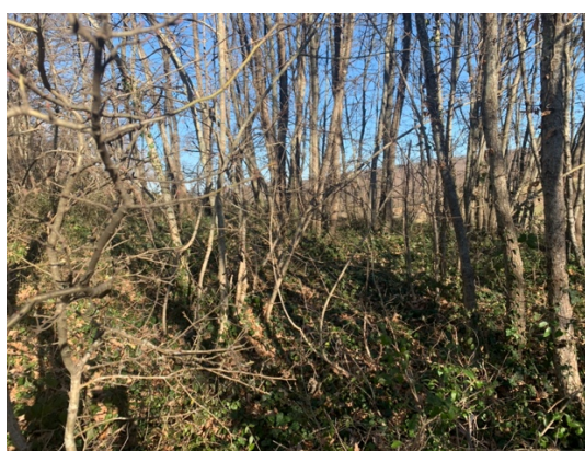
Vista interna dell'area boscata