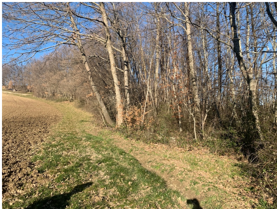
Vista esterna dell'area boscata circondata da superfici a seminativo (particolare)

La documentazione fotografica è riferita alla data di febbraio 2022