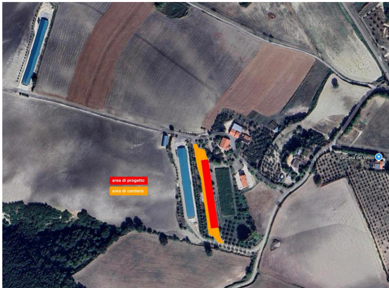
Ortofoto con localizzazione delle aree di P//A e aree di cantiere