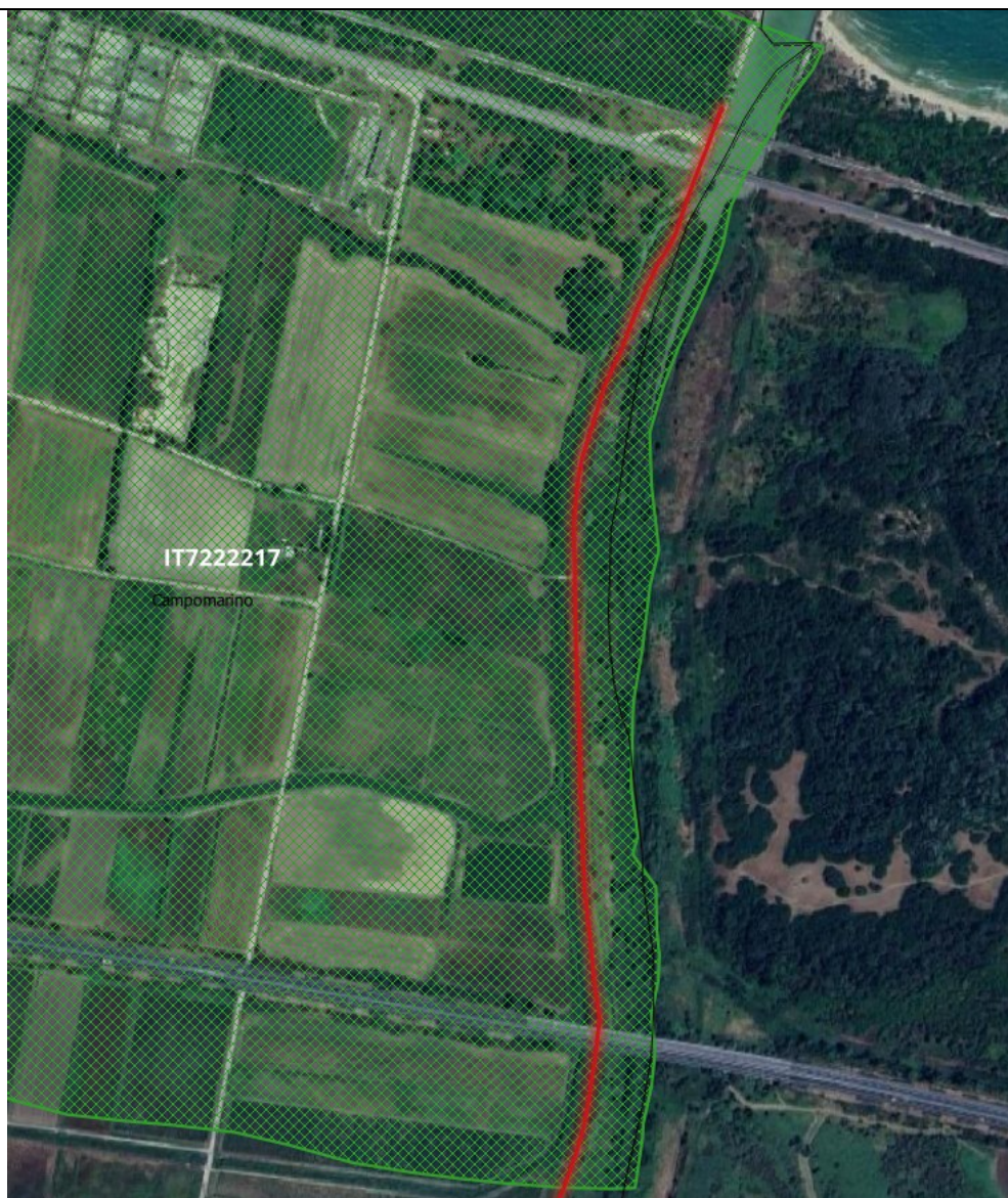
Figura 4. Particolare del tratto di sponda in sinistra idrografica del F. Saccione nel comune di Campomarino (CB) oggetto di sfalcio all'interno della ZSC IT7222217.