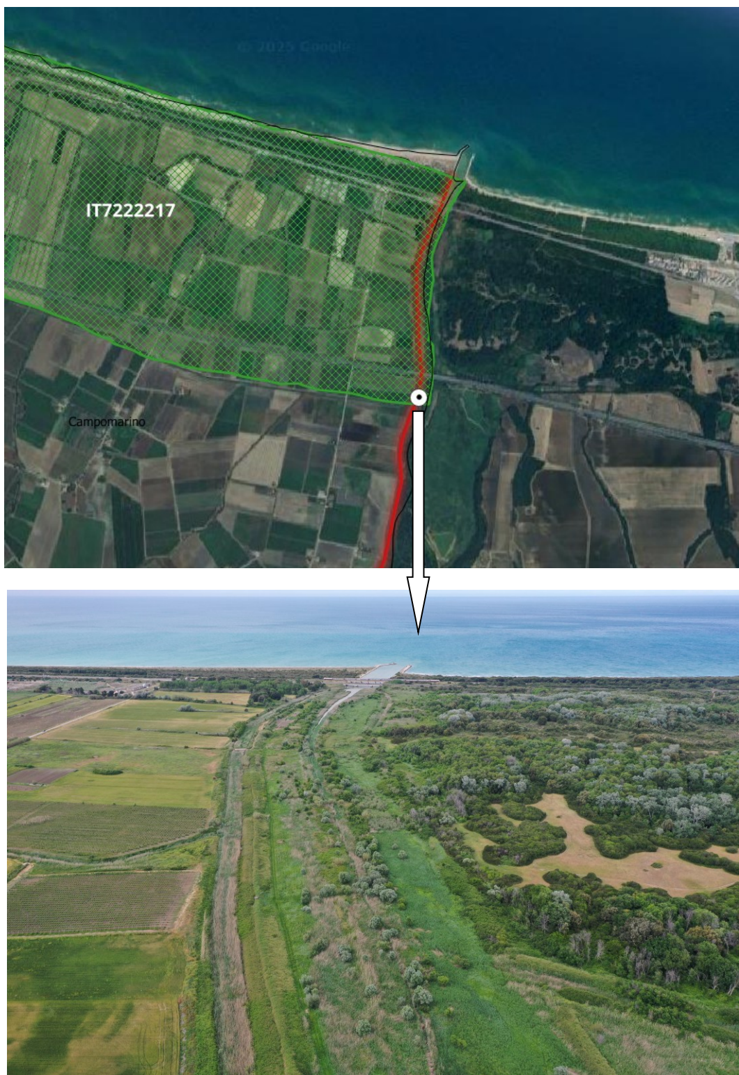
Figura 1 – Stato di fatto (ripresa fotografica aerea dell'area della ZSC oggetto di intervento).

Fermo restando che le opere che saranno previste in sede di progettazione definitiva saranno sottoposte al procedimento di Valutazione di Impatto Ambientale (VIA) coordinata con la Valutazione di Incidenza Ambientale (VincA) ai sensi del D.Lgs. 152/2006 e ss.mm.ii., al fine di eseguire solo i rilievi piano altimetrici