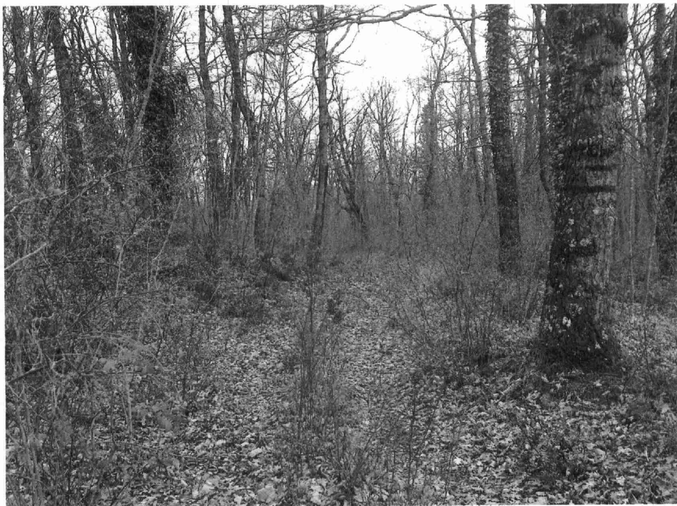
Foto n. 1 - Viabilità - ripulitura