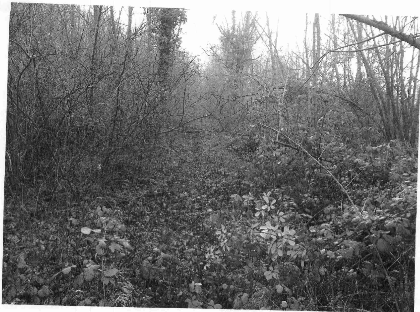
Foto n. 1 - Viabilità - ripulitura