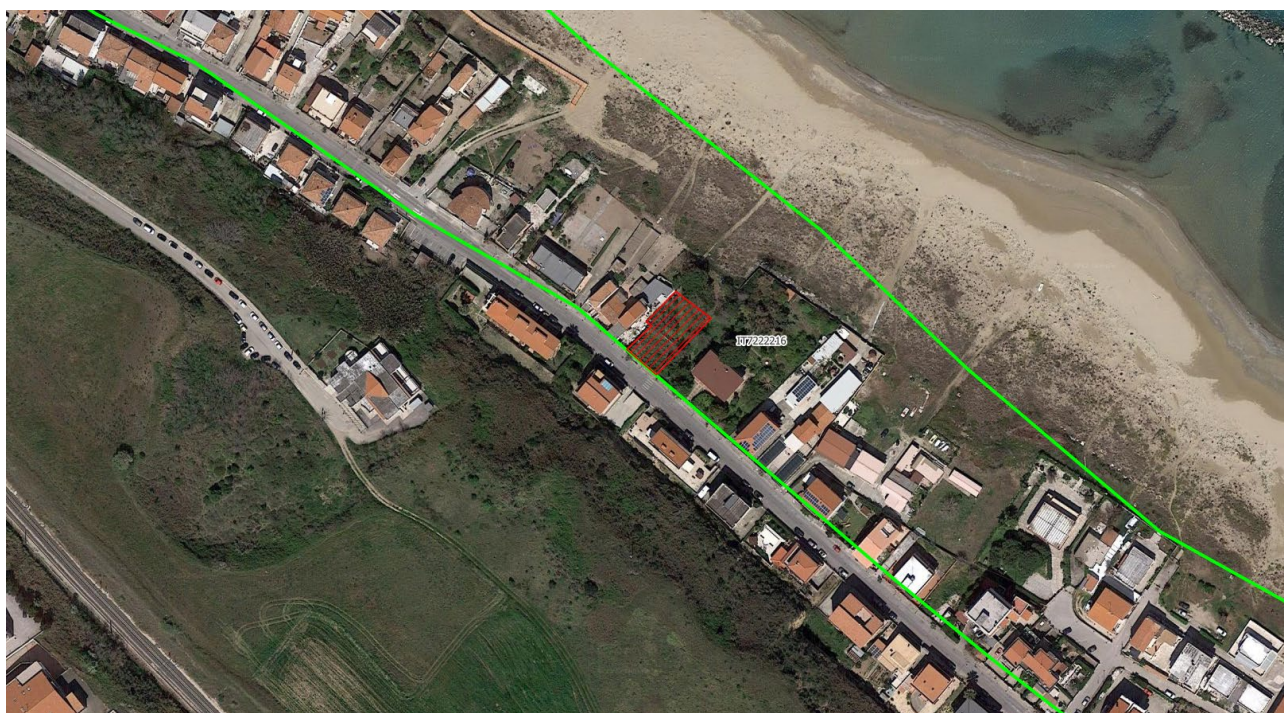
Figura – Area di intervento (in rosso) e SIC IT7222216 (limiti in verde)