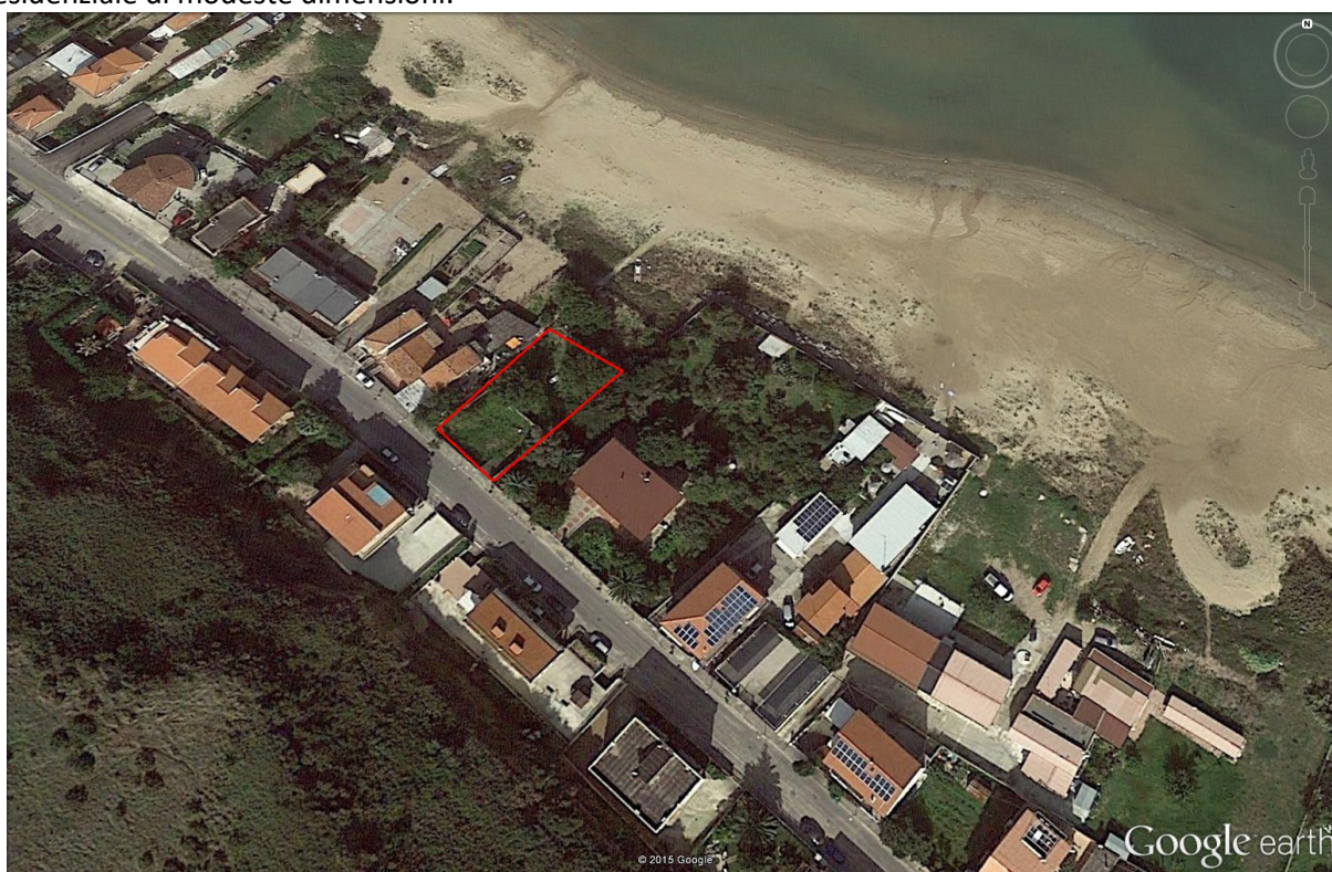
Figura – Ortofoto con ubicazione dell'area di intervento

Su detti terreni edificabili stretti tra l'arteria viaria e la costa, la società intende realizzare un edificio residenziale di modeste dimensioni.