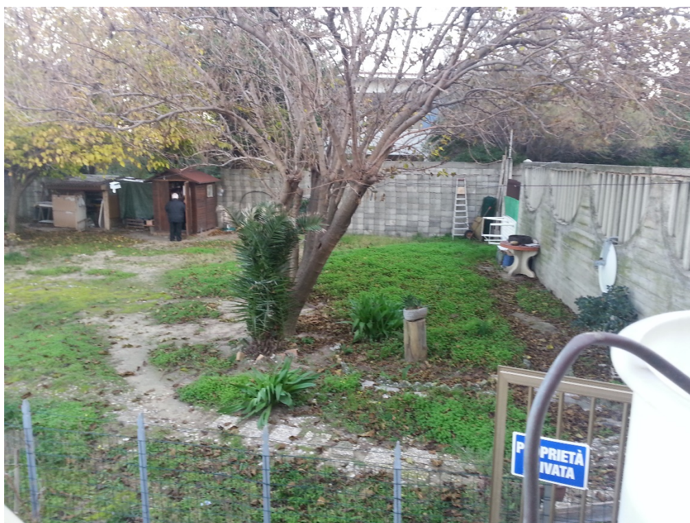
Figura – Area di intervento stato attuale