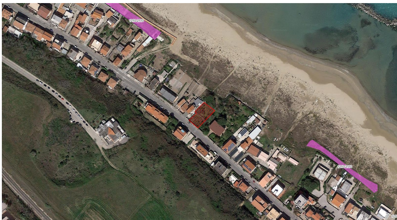
Figura – Area di intervento (in rosso) e habitat censiti