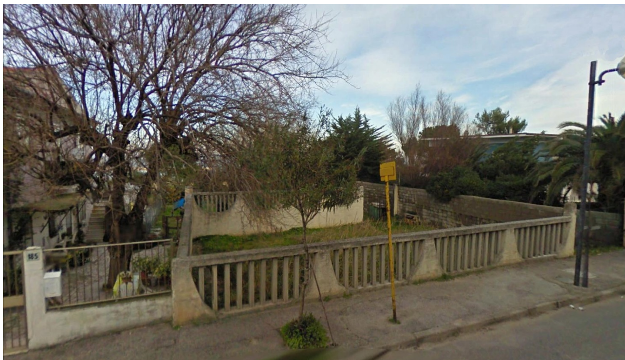
Figura – Area di intervento stato attuale