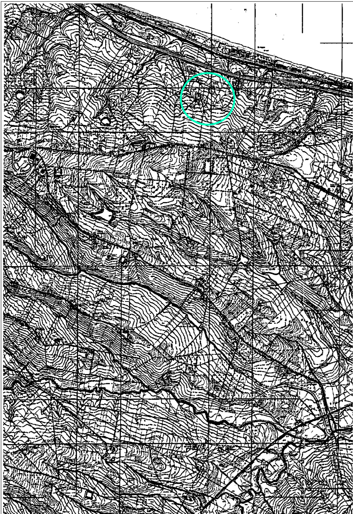
COROGRAFIA rapp. 1:25.000