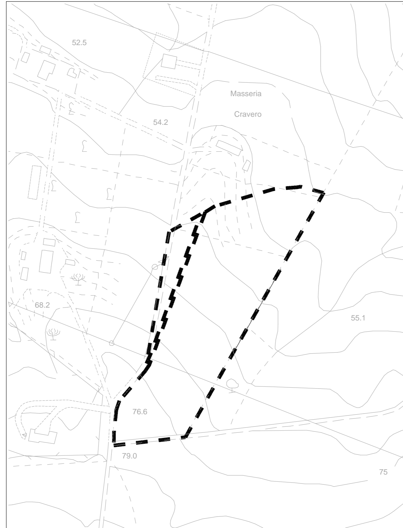
CONFORMAZIONE PLANO-ALTIMETRICA DELL'AREA rapp. 1: 2.000