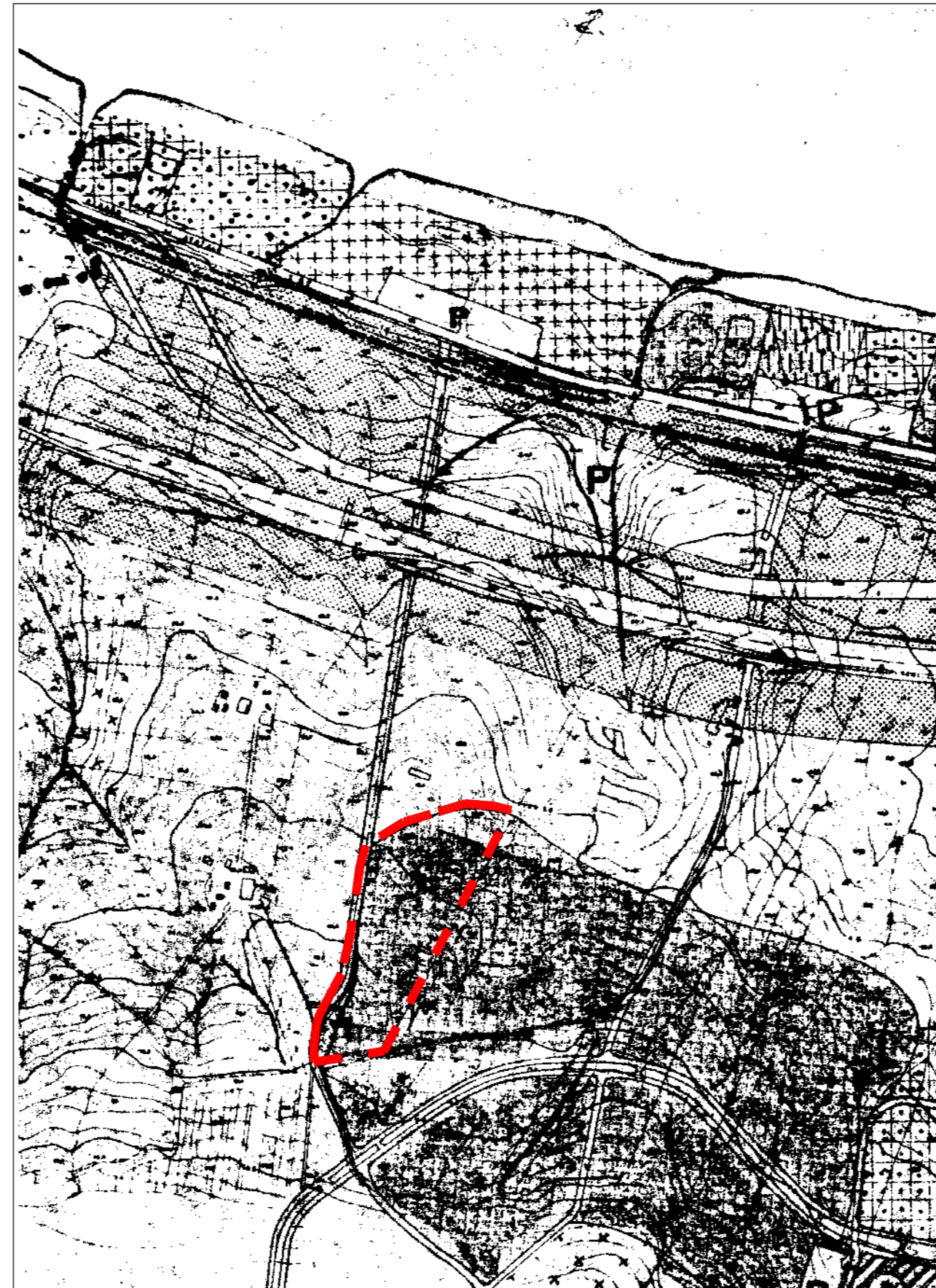
STRALCIO DEL PRG VIGENTE rapp. 1:5.000 destinazione: parte C5 - residenze parte strade di P.R.G.