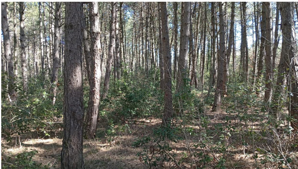
Pineta p.lla 73