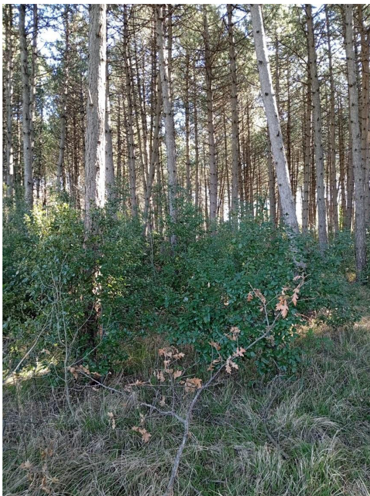
Pineta p.lla 73 abbondante rinnovazione di leccio