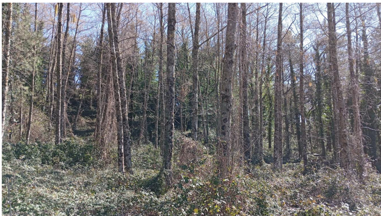
Ontaneto p.lle 11, 60, 61 e 62 con tappeto di rovo