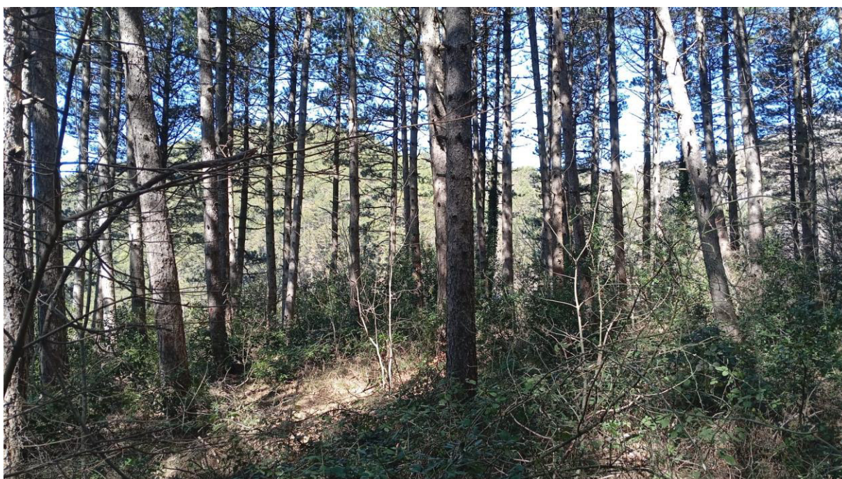
Pineta p.lla 73